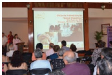
Conferencias y foros de discusión.